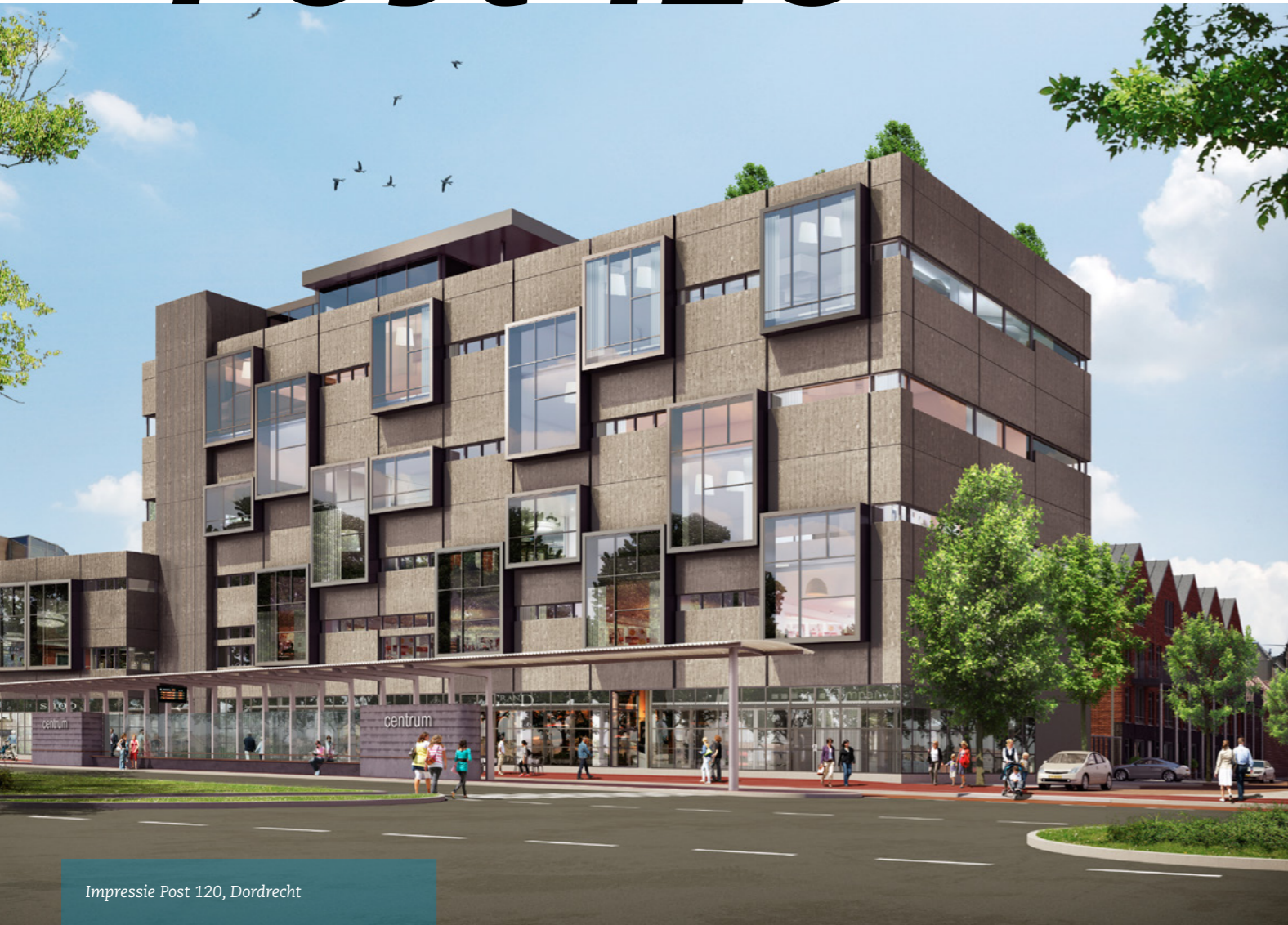
Impressie Post 120, Dordrecht