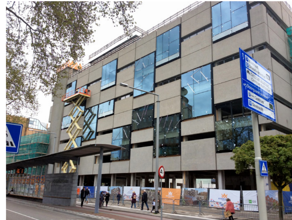
Verbouwing aan de Johan de Wittstraat in volle gang

Doordat er minder materialen worden gemaakt en er geen vrachtwagens nodig zijn om het onnodige extra sloopafval af te voeren scheelt dit energie, uitstoot, onnodig lawaai en vervuiling. Daarnaast is tijdens de ontwikkeling getracht zo min mogelijk schade aan de omgeving aan te brengen. M3E is als BREEAM-adviseur nauw betrokken bij deze revitalisatie.